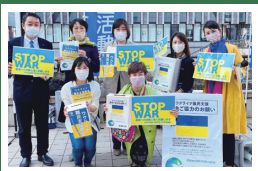
ウクライナ避難民支援募金活動。 Nowar! 平和主義を守り抜く。