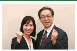
教育現場の声を市政へ! 水岡俊一参院会長と志ともに。