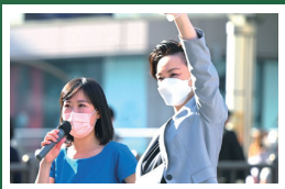
立川駅で、女性デモ街宣。 吉田はるみ衆院議員も激励!