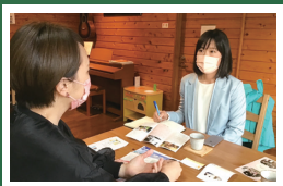
昭島市「助産院こもれ屋」で 産後ケアについて学ぶ。