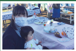
子ども食堂でお手伝い。市内に もっと増えたいいな。