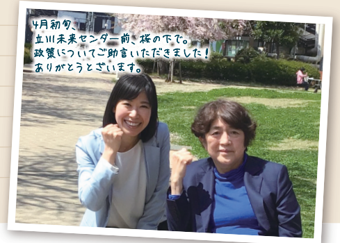
4月初旬、立川未来センター前、桜の下で。政策についてご助言いただきました! ありがとうございます。